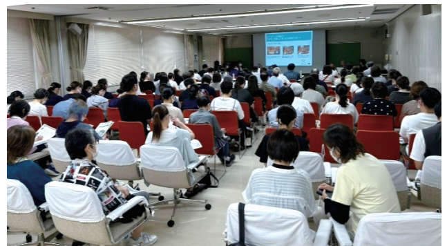
当日は当事者の方をはじめ、会場は多くの方で賑わいました