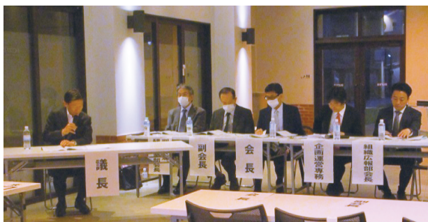
粛々と進行する会の様子