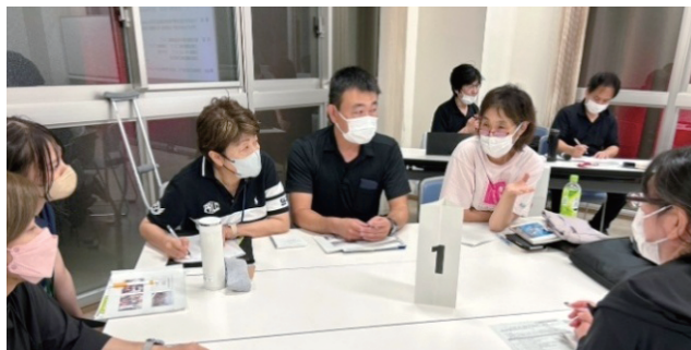
意見交換会の一コマ