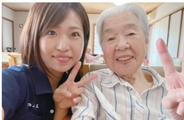
社会福祉法人博愛福祉会 小規模多機能型ホームよしの

まずはケアを提供する私たちが健康であることです。そうでないと絶対に質の高いケアは提供できないと考えるからです。そのためにストレスをため込まないように心がけ、工夫しています。スタッフ同士で談話したり、適度に運動したりしています。とてもいい環境で勤務させていただいており、感謝しています。